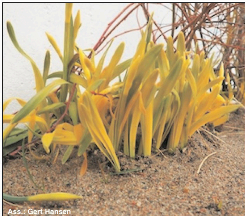
Ass.: Gert Hansen

5. april 2023 www.kujataamiu.gl · mail: kujataamiu@gmail.com